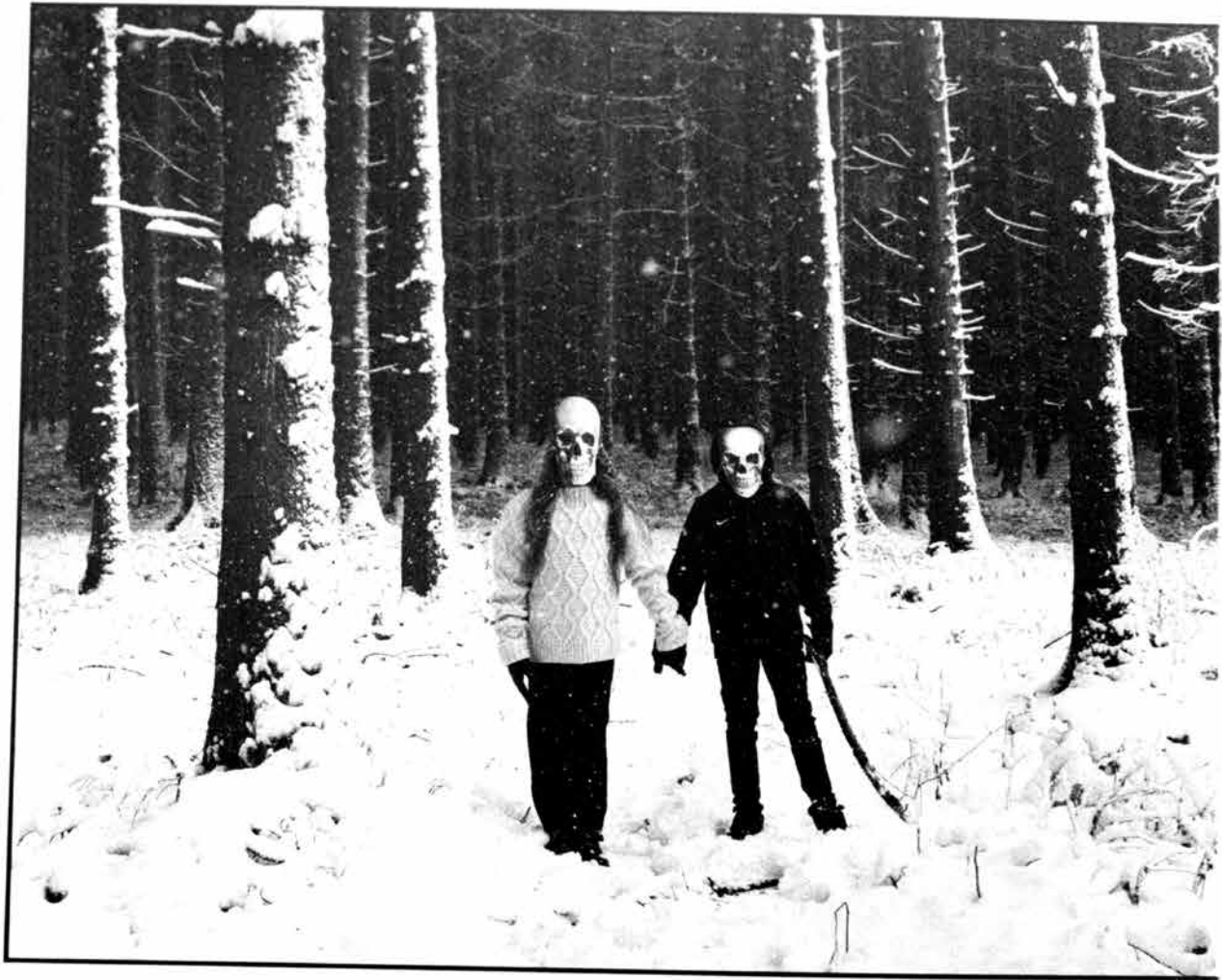
Thalheim 2021. Corona - Fichtenwald bei Schneefall | Corona - Spruce Forest during Snowfall