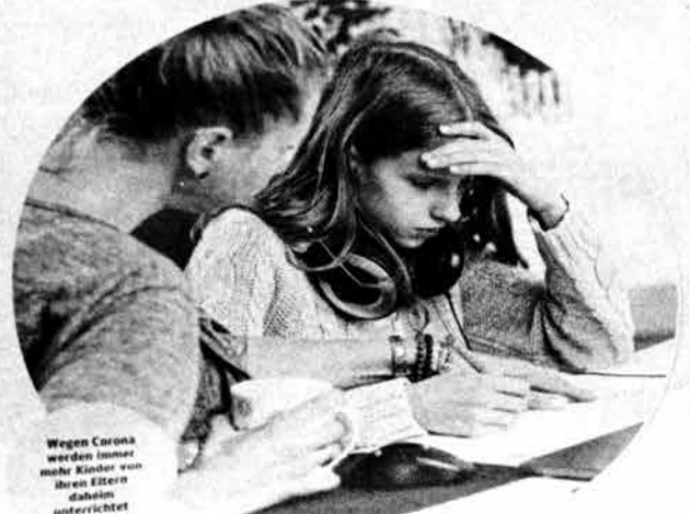
Wegen Corona werden immer mehr Kinder von ihren Eltern dahoim unterrichtet

Heimunterricht. Im vergangenen Schuljahr sind 1.020 Kinder nicht zur verpflichtenden Abschlussprüfung erschienen. Welche Konsequenzen nun drohen und warum es zu einem Rechtsstreit kommen könnte.